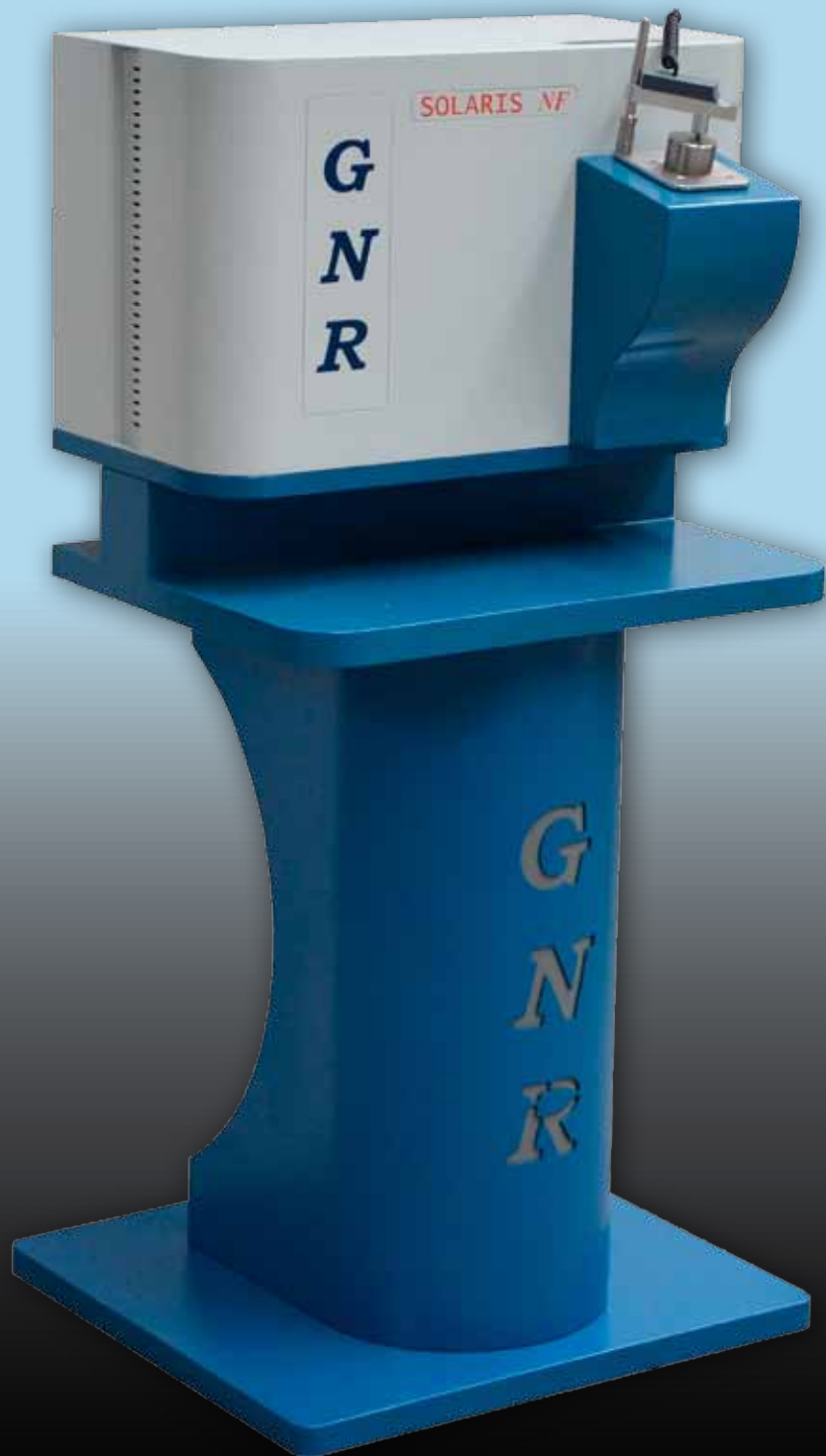
Non-Ferrous Alloys Optical Emission Spectrometer

ANALYTICAL INSTRUMENTS GROUP 25 years of technology